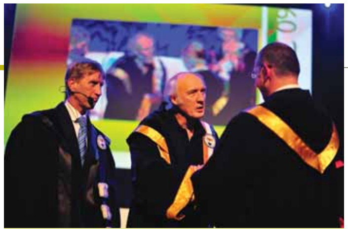
Herman Van Veen